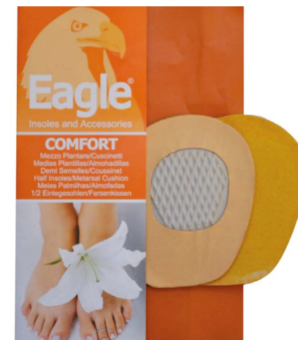
Goccia antiscivolo pelle e lattice Anti-slip drop | 1 size

Mini Mittelfußsohle. Sie Bietet viel Komfort dank seiner drei Schichten. Die obere Schicht ist aus echtem, pflanzlich gegerbtem Leder. Die Mittelschicht aus atmungsaktivem Latex schaum und die untere Schicht aus geprägten Latex.