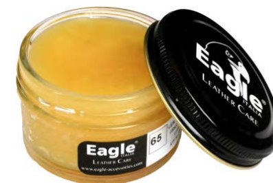
Grasso per pelli Leather grease

IT - Grasso neutro, origine animale. Nutre, protegge ed ammorbidisce il cuoio. Alto potere impermeabilizzante