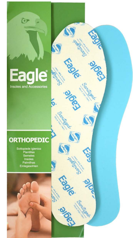
Plantare pelle pregiata e lattice verde Premium leather, green latex | 35/36 -> 45/46