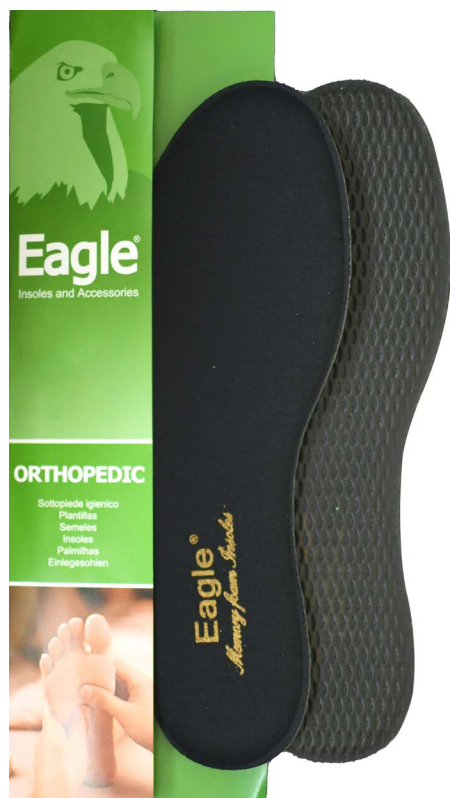
Sottopiede in memory foam standard Memory foam and carbon | 35 -> 46