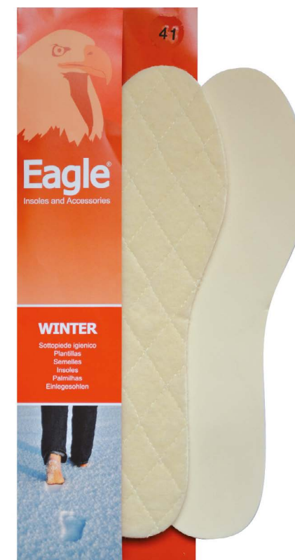
Sottopiede lana trapuntata Quilted wool | 35 -> 46

Eine Einlegesohle, die die Temperatur der Füße behält, dank der oberen Schicht des gemusterten Fleece. Die Komfort und Wärme bietet. Die zweite Schicht besteht aus hochdichtem, atmungsaktivem Latexschaum mit einer Anti-Rutsch- Oberfläche.