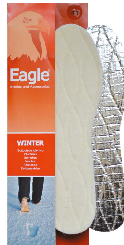
Sottopiede in lana termica Thermal wool | 35 -> 46