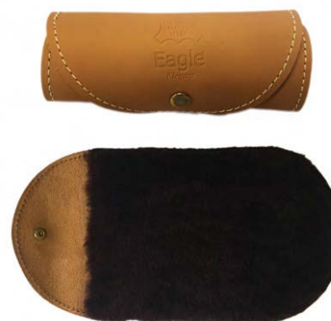
Guanto in lana per lucidare Wool glove

IT - Guanto per lucidare, in vero agnello. Soffice e delicato, dona brillantezza alla pelle.