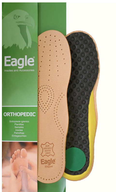
Plantare Anti-Shock pelle e lattice Anti-Shock, leather and latex | 35/36 -> 45/46