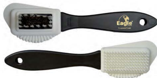
Spazzolino scamosciati Suede care brush

IT - Spazzolino per scamosciati e nubuck. Da un lato nylon e ottone per eliminare tracce di sporco, dall'altro gomma per ravvivare.