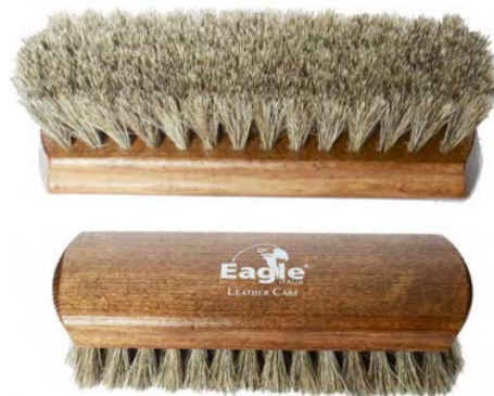
Spazzola per lucidare Shoe shine brush

IT-Spazzola in crine di cavallo con manico in legno. Essenziale per lucidare le calzature.