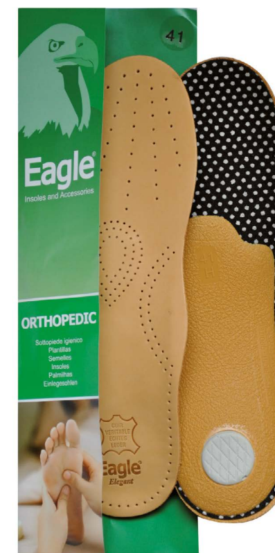
Plantare pelle pregiata e tessuto Premium leather and textile | 35 -> 46

Anatomische Halbinsensole aus hochwertigem, pflanzlich gegerbtem Leder mit Anti-Allergie und Absorptionseigenschaften auf der oberen Schicht.