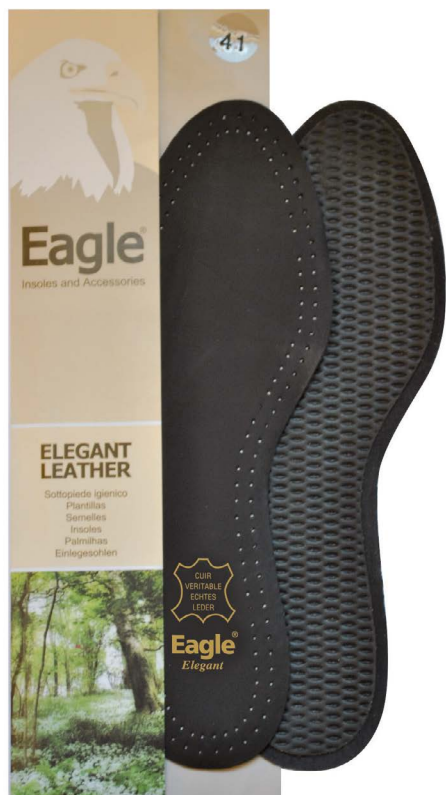
Sottopiede in pelle nera e lattice Black leather and latex | 35 -> 46