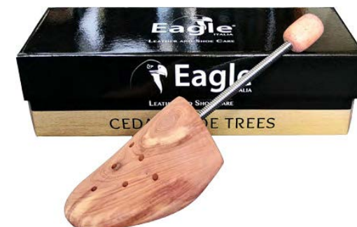
Tendiscarpe "spirale" Spiral shoe tree

IT - Forma tendiscarpe in cedro di prima qualità con molla in metallo. Assorbe gli odori e mantiene in forma le calzature.