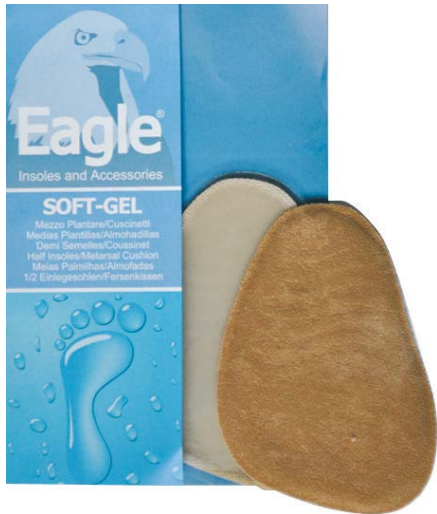
Mezza soletta alcantara e gel Half insole suede and gel | 1 size