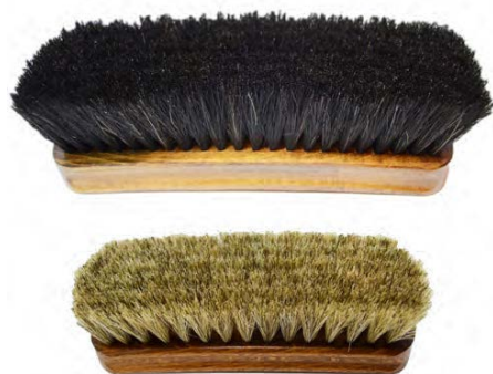
Spazzola in crine Horsehair brush

IT - Spazzola in crine di cavallo con manico in legno. Essenziale per lucidare le calzature.