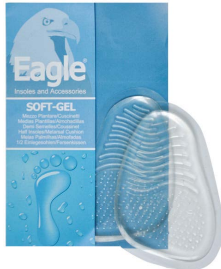
Mezza soletta in gel Gel half insole | 1 size

Mittelfußpolster aus Kuh-Wildleder mit atmungsaktiver Latexschaum-Basis. Er bietet Dämpfung im Mittelfußbereich und verhindert, dass der Fuß nach vorne rutscht.