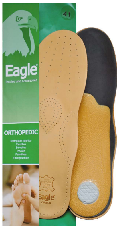
Plantare pelle pregiata e lattice Premium leather and latex | 35 -> 46