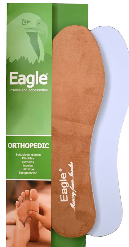
Sottopiede in memory e scamosciato Memory and suede | 35 -> 46

Die schlanke Memory-Foam-Einlegesohle mit Latex-Kohle-Boden bietet außergewöhnlichen Komfort und Unterstützung. Sie passt sich der Form Ihres Fußes an, absorbiert Stöße und reduziert den Druck. Ihr schlankes Design nimmt wenig Platz in Ihrem Schuh ein. Der Latex-Kohle-Boden bietet Haltbarkeit und Geruchskontrolle.