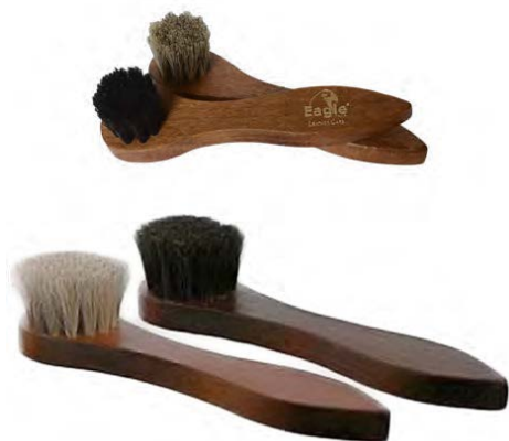
Spazzolino spandicrema Shoe polish brush

IT-Spazzola in crine di cavallo con manico in legno. Essenziale per lucidare le calzature.