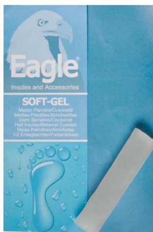
Tube copridita in silicone Toes protection | size 1-3