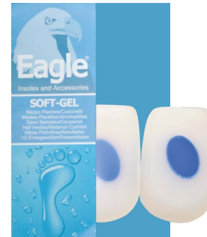
Alzatacco standard in silicone Gel heel lift | size 1-3

Schützende Fersenstütze. Sie bietet Linderung und Komfort.