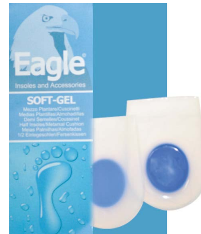
Tallonetta piatta in silicone Heel protection | 1-2-3

Fersenkissen. Dank seiner sehr weichen, besonderen Dichte des Mikro-Traumata, absorbiert und verhindert es Schäden und Verletzungen.