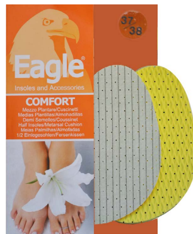
Mezza soletta lattice profumato Perfumed latex | 1-2-3-4

Plantar Kissen von absorbierendem Stoff, für ein angenehmes Frischegefühl, auf atmungsaktiver Latexschaum-Basis, lässt die Luft zirkulieren und bietet stoßdämpfende Eigenschaften.