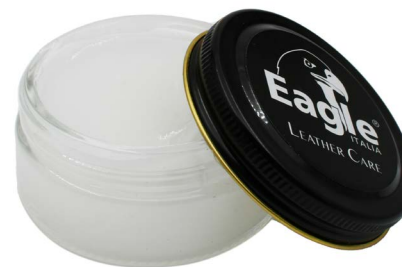
Crema gel Gel cream

IT - Crema delicata adatta a tutti i pellami. Nutre, rigenera e protegge preservando le caratteristiche originali.