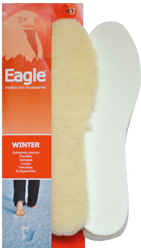
Sottopiede in lana pelliccia Fur wool | 35 -> 46