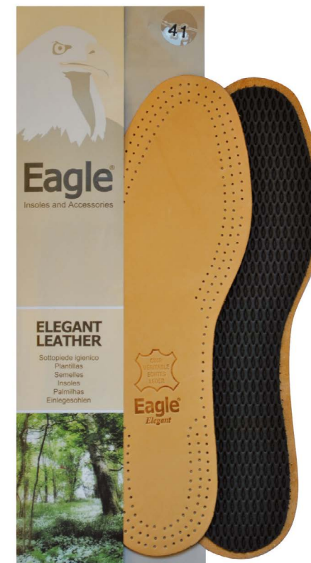
Sottopiede pelle pregiata e tessuto Premium leather and textile | 35 -> 46