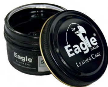
Crema lucidante Shoe cream

IT - Crema coprente per pelle liscia, a base di cera d'api e di carnauba. Rinnova i colori, nutre e dona brillantezza.