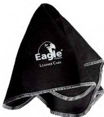
Panno in lana Wool cloth

IT - Panno in lana-cotone. Perfetto per lucidare calzature in pelle liscia.