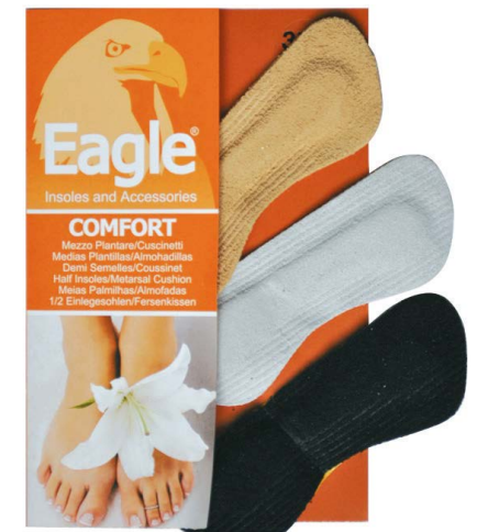
Salvacalze antiscivolo adesivo Heel protector | 1 size

Mittelfußhebekissen, die großen Komfort, dank ihrer Zusammensetzung, bieten: atmungsaktiv, weicher Latexschaum und echtes Leder. Empfohlen für mittlere und hochhackige Schuhe. Selbstklebend.