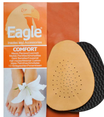
Mezza soletta con metatarso Mini metatarsal insole | 1 size

Halbinnensohle von absorbierendem Stoff, parfümiert mit Chlorophyll Essenz. Atmungsaktive Latexschaum-Basis.