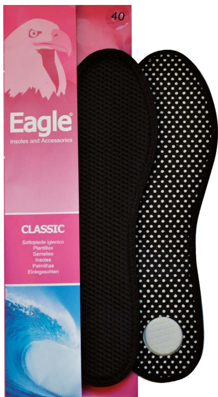
Sottopiede in tessuto tecnico e carbone Tech fabric and carbon | 35 -> 46