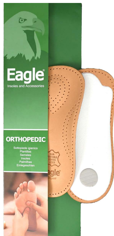
Mezzo plantare pelle pregiata Half insole premium leather | 35 -> 46

Anatomische Innensohle für Menschen empfohlen, die eine lange Zeit mit Stehen oder Spaziergängen verbringt. Sie ist aus hochwertigem, pflanzlich gegerbtem Leder mit Anti-Allergie- und Absorptionseigenschaften auf der oberen- und Latex an der unteren Schicht, gemacht.