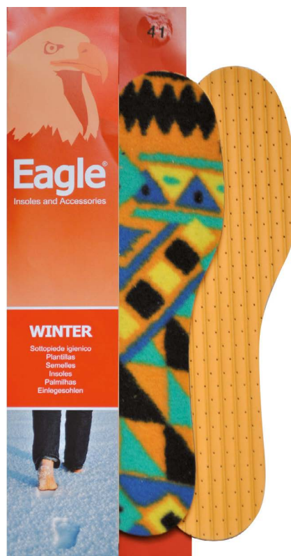
Sottopiede in pile multicolor Fleece and latex | 35 -> 46

Eine Einlegesohle, die die Temperatur der Füße dank der Oberschicht aus 100% Naturwolle behält, und die Komfort und Wärme bietet. Der Sockel ist aus Polyethylen, der vollständige Isolierung vor Feuchtigkeit bietet.