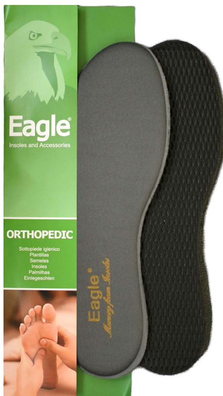
Sottopiede in memory foam sottile Slim memory foam and carbon | 35 -> 46

Die Memory-Foam-Einlegesohle mit Latex-Kohle-Boden bietet außergewöhnlichen Komfort und Unterstützung. Sie passt sich der Form Ihres Fußes an, absorbiert Stöße und reduziert den Druck. Der Latex-Kohle-Boden bietet erhöhte Haltbarkeit und Geruchskontrolle, wodurch jeder Schritt bequemer und erfrischender wird.