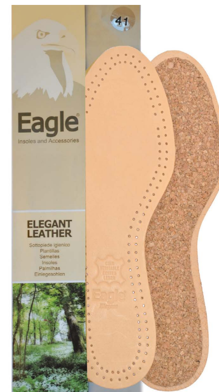
Sottopiede in cuoio forato Vegetable tanned leather with pattern | 35 -> 46