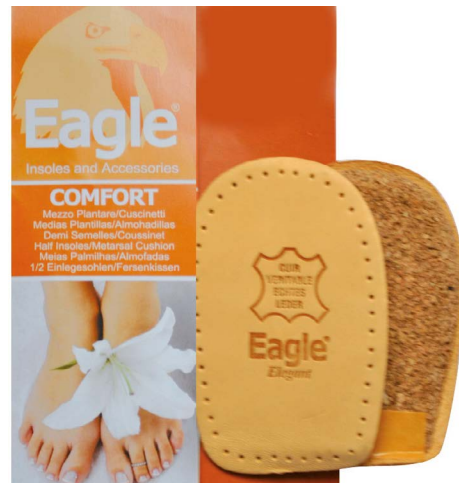
Alzatacco sughero e pelle pregiata, 10 mm Heel lift, cork and leather | 1-2-3

Fersenkissen. Aus echtem Leder und Natur Presskork. Höhe 25 mm. Selbstklebend.