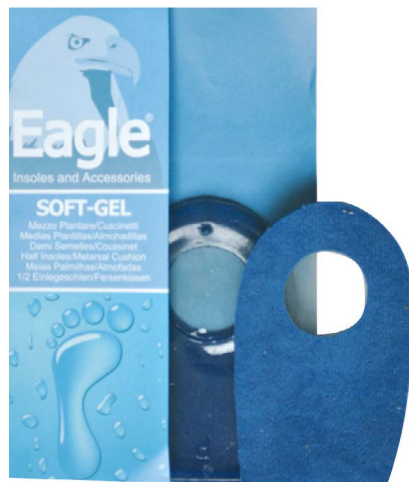
Alzatacco in alcantara e gel Alcantara and gel lifter | size 1-2-3

Er lindert und verhindert Reibung und Druck auf die Zehen.