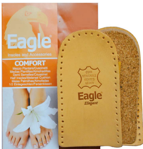
Alzatacco sughero e pelle pregiata, 25 mm Heel lift, cork and leather | 1-3