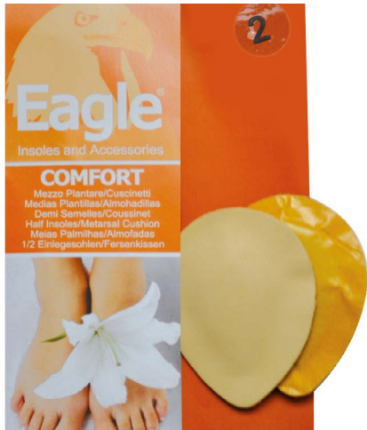
Oliva pelle e lattice Metatarsal lift | sizes 1-2-3-4