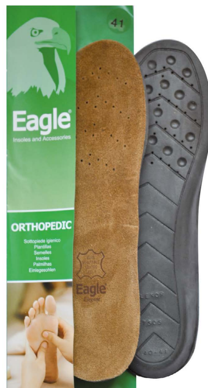
Plantare in lattice e camoscio Suede and latex | 36/37 -> 46/47

Anatomische Innensohle aus feinem Leder, atmungsaktivem Schaum und anatomische Unterstützung mit viskoelastischen Kissen im Fersenbereich.