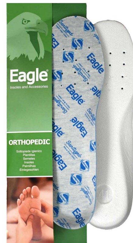
Plantare tessuto sportivo Sanitized sport textile | 35 -> 46

Anatomische Innensohle aus Rindsleder. Wildleder auf der obersten Schicht und die untere Schicht besteht aus atmungsaktivem Latexschaum mit Aktivkohle, die unangenehme Gerüche und Schweiß verhindert.