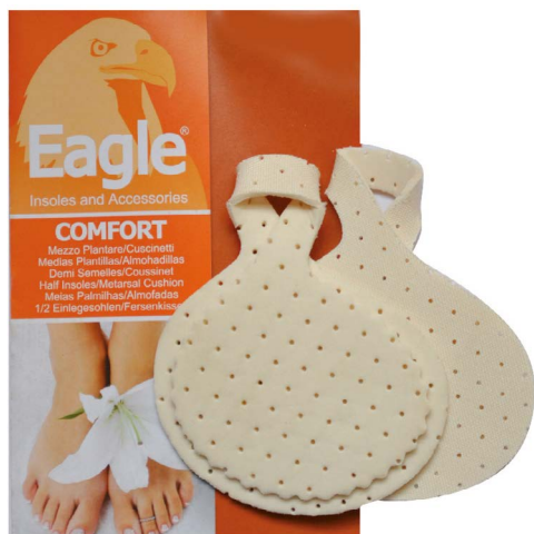
Mezza soletta latex bianca Latex half insole | 1 size