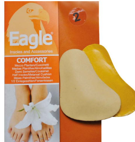
Cuscinetto pelle e lattice Metatarsal lift pad | sizes 1-2-3-4

Schaft Unterstützung, um das inneren Längsgewölbe zu entlasten. Sie Bietet Komfort dank des echten, pflanzlich gegerbten Leder mit Anti-Pilz- und Absorptionseigenschaften und seines anatomisch geformten Gummiteils. Selbstklebend.