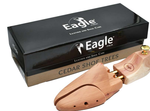
Forma tendiscarpe in cedro Cedar shoe tree

IT - Forma tendiscarpe in cedro di prima qualità con pomello in ottone. Assorbe gli odori e mantiene in forma le calzature.