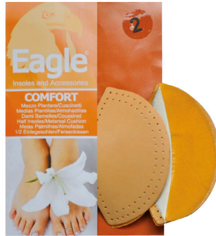
Arcoplantare pelle e gomma Shank support | sizes 0-1-2-3

Mittelfußhebekissen, die großen Komfort bieten, dank der Zusammensetzung aus atmungsaktivem, weichem Latexschaum und echtem Leder. Empfohlen für mittlere und hochhackige Schuhe. Selbstklebend.