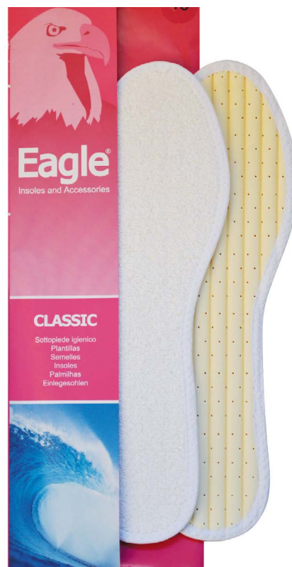
Sottopiede spugna e lattice Terry fabric and latex | 35 -> 46

Eine Brandsohle mit einem technischen Stoff; die zweite Schicht besteht aus Filz mit einem hohen Gehalt an Aktivkohlepartikeln, die Schweiß absorbieren. Das Pad im Fersenbereich ist so konzipiert, um die Auswirkungen beim Gehen abzufedern.