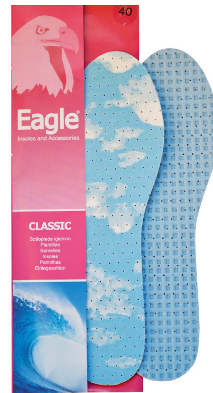
Sottopiede lattice deodorante Textile and perfumed latex | 35-46

Eine Brandsohle mit einer Deckschicht aus absorbierendem Stoff, der ein angenehm, frisches Gefühl verleiht. Die zweite Schicht besteht aus hochdichtem, atmungsaktivem Latexschaum mit einer Anti-Rutsch-Oberfläche im Fersenbereich ist so konzipiert, um die Auswirkungen beim Gehen abzufedern.