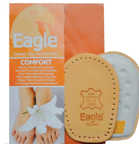
Alzatacco lattice e pelle pregiata Heel lift, latex and leather | 1-2-3-4

Langes, gepolstertes Fersenkissen. Komfortable dank dem pflanzlich gegerbtem Leder und seinem atmungsaktiven Latexschaum. Selbstklebend.