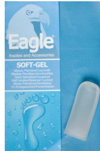
Ditale copridita in silicone Toes cover | size 1-3

Mini-Gel-Einlegesohle bietet große Erleichterung, indem sie den Druck auf die Köpfe des Mittelfußknochens ausübt und die Bildung von Hornhaut verhindert. Sie kann mit Wasser und Seife gewaschen werden, um erneut Halt zu erlangen.