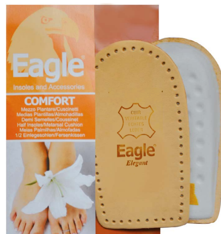
Alzatacco lattice lungo e pelle pregiata Heel lift, latex and leather | 1-2-3-4

Fersenkissen. Aus echtem, pflanzlich gegerbtem Leder und Natur Presskork. Höhe 10mm. Selbstklebend.