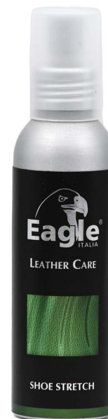
Allargascarpe Shoe stretch

IT - Dilatatore per calzature. Grazie alla sua speciale formula, ammorbidisce la pelle donando comfort ai piedi. Adatto per pelle liscia e scamosciata.